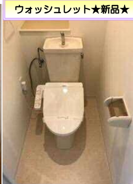
ウォッシュレット★新品★