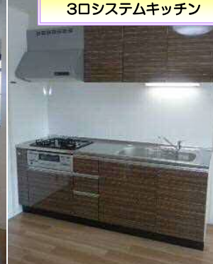
3口システムキッチン