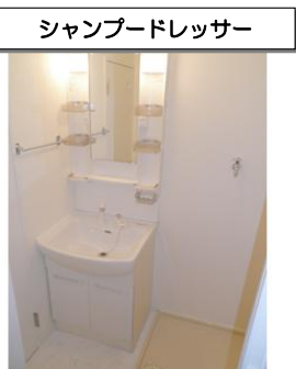
シャブードレッサー