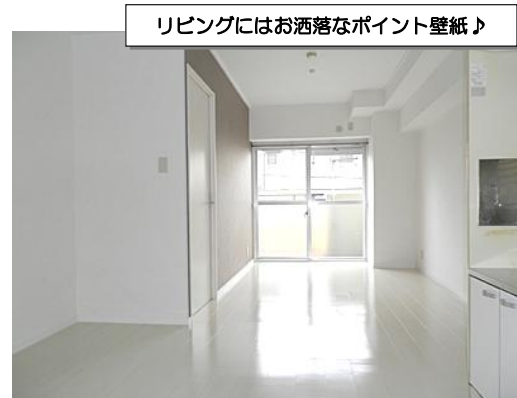
リビングにはお洒落なポイント壁紙♪