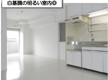
白基調の明るい室内◎

必要書類 契約者様…住民票、顔写真、身分証、収入証明 同居人様…住民票、顔写真 保証人様…印鑑証明、収入証明（※内容により追加の場合があります）