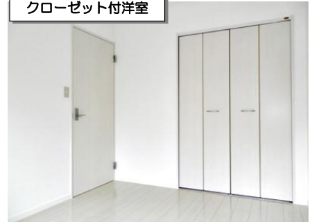
クローゼット付洋室