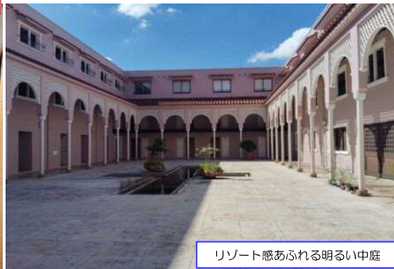
リゾート感あられる明るい中庭