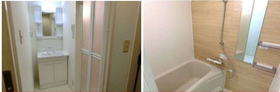
新品洗面化粧台&新品ユニットバス