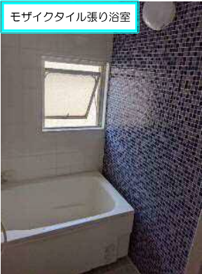
モザイクタイル張り浴室