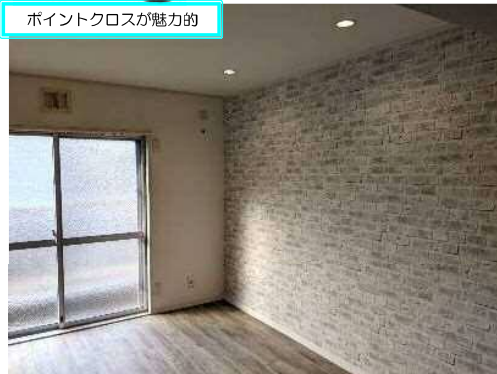
ポイントクロスが魅力的