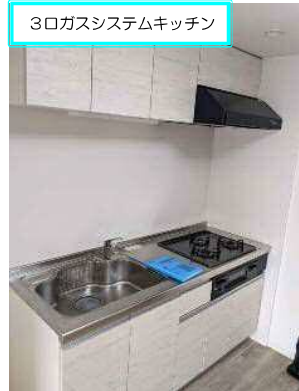
3コガスシステムキッチン