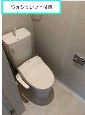
ウォシュレット付き