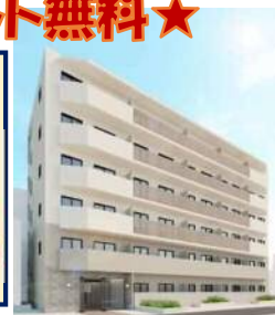
※写真は同間取の別室のものです。現状優先。