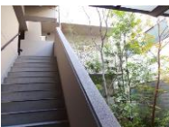
癒しの緑と共に暮らす生活♪