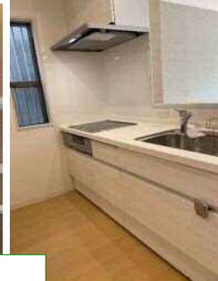
分譲グレード設備充実★

必要書類 契約者様…住民票、顔写真、身分証、収入証明 同居人様…住民票、顔写真 保証人様…印鑑証明、収入証明（※内容により追加の場合があります）