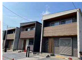
収納たくさん！広々土間プラン

希少な戸建賃貸★子育て世帯におすすめ♪ ゆったり駐車スペース付★2台可（普通車1台＋軽自動車1台程度） 分譲グレードの設備★ワイドシステムキッチン・浴室乾燥機付ユニットバスなど充実◎ 抜群の収納力★広々土間プラン＋玄関収納＆パントリー＆WinCL！