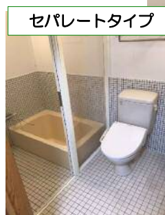
セパレートタイプ