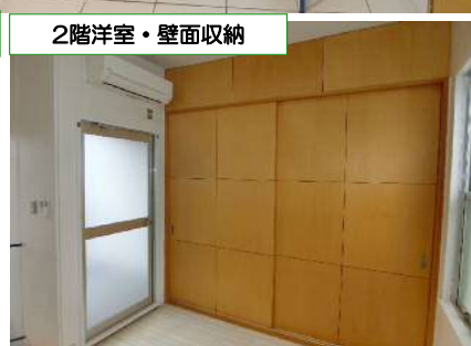
2階洋室・壁面収納