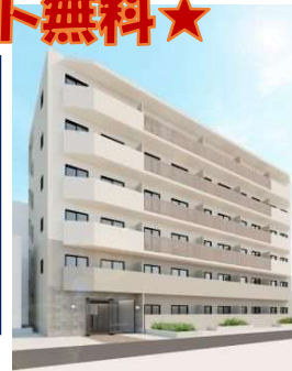
※写真は同間取の別室のものです。現状優先。