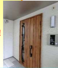
オートロック&防犯カメラ