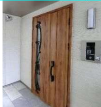
オートロック&防犯カメラ