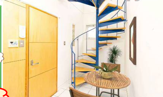
※写真は家具設置イメージです。現状優先