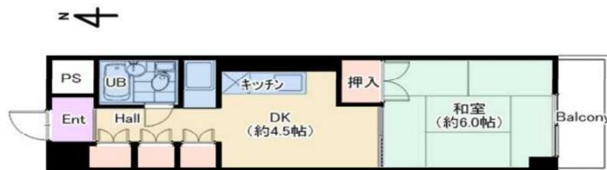
※室内写真は一部別室のものです。現況優先とします。

夜間エントランス施設・管理人日勤で女性も安心♪ 24時間ゴミ出しOK！ 利便性◎