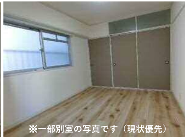
※一部別室の写真です（現状優先）