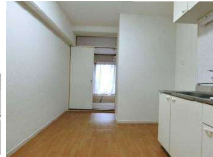
※室内写真は一部別室のものです。現況優先とします。