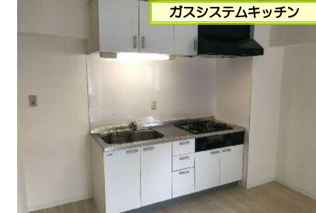
ガスシステムキッチン

必要書類 契約者様…住民票、顔写真、身分証、収入証明 同居人様…住民票、顔写真 保証人様…印鑑証明、収入証明（※内容により変更の場合あり）