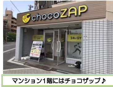
マンション1階にはチョコザップ♪