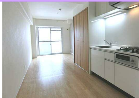
クロスがお洒落なりノベ部屋♪