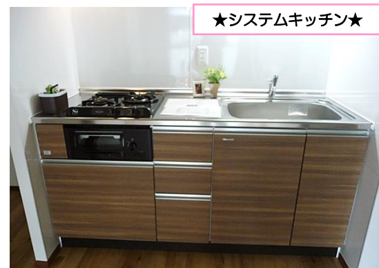
★システムキッチン★

必要書類 契約者様…住民票、顔写真、身分証、収入証明 同居人様…住民票、顔写真 保証人様…印鑑証明、収入証明(※内容により変更の場合あり)